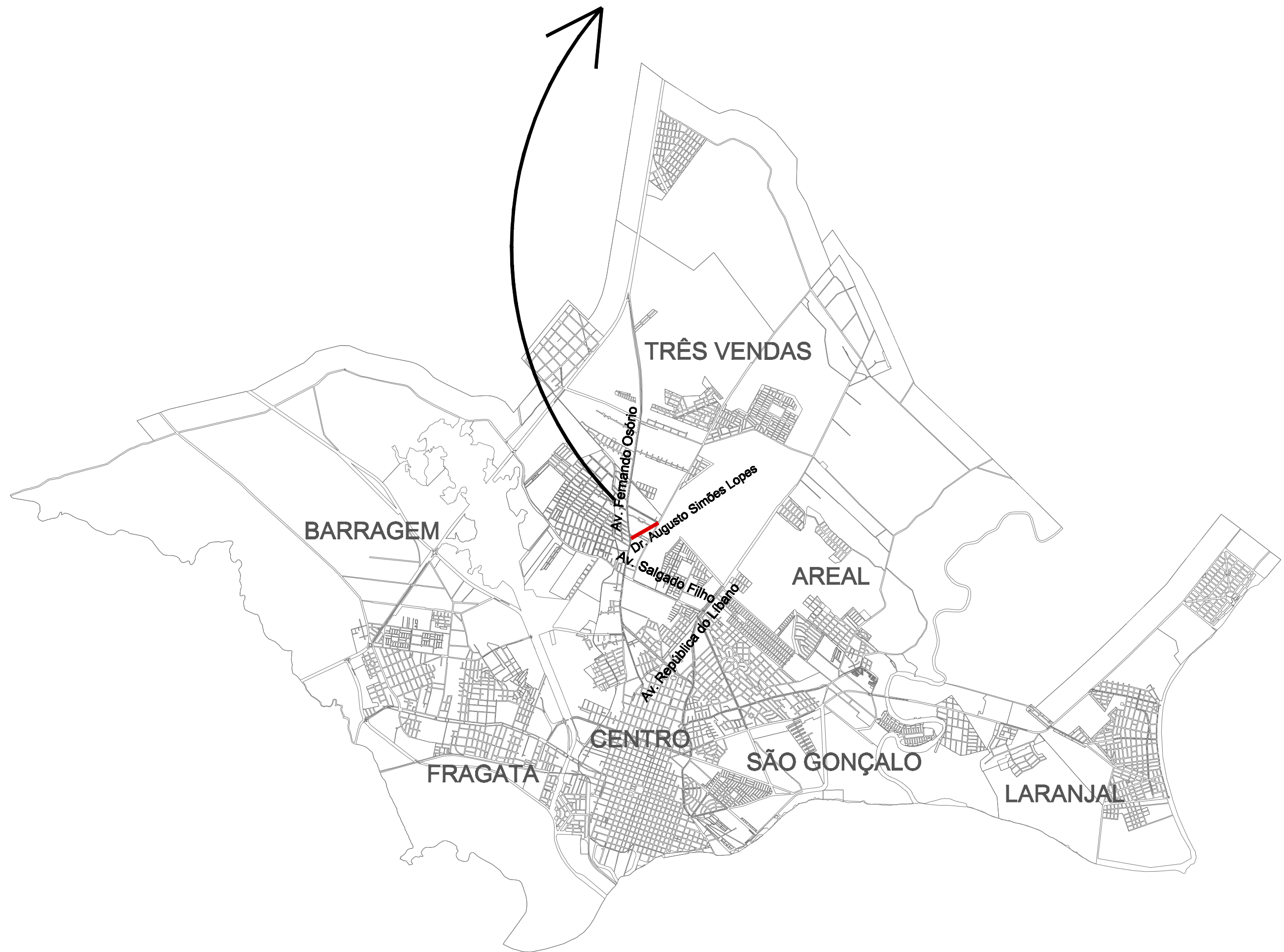
03 | PLANTA DE MACRO LOCALIZAÇÃO - RUA DR. AUGUSTO SIMÕES LOPES PELOTAS / RS ESCALA 1:750