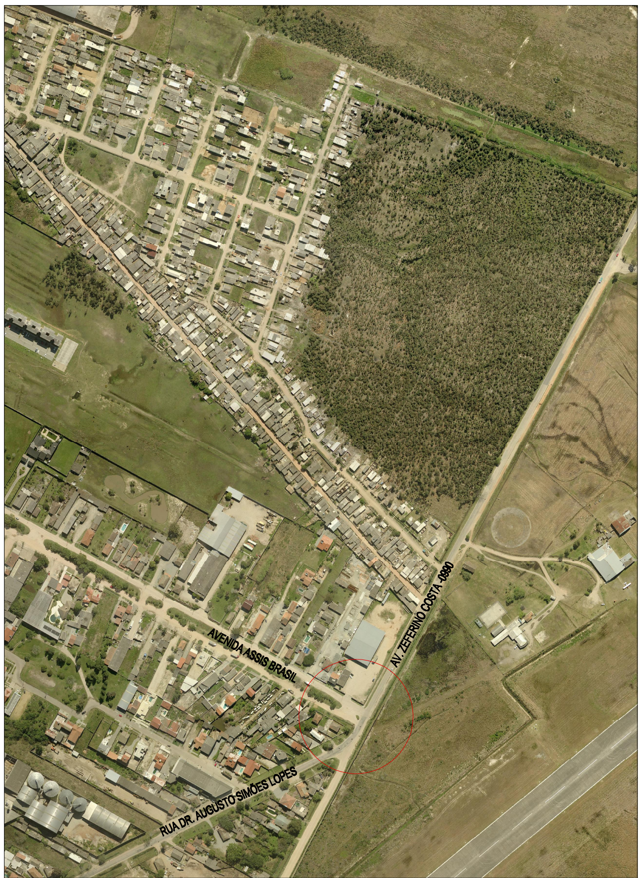
04 | IMAGEM 01 - PONTO DE CONEXÃO ENTRE RUAS ASSIS BRASIL / ZEFERINO COSTA / DR. AUGUSTO SIMÕES LOPES